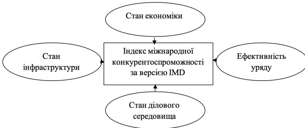
Рис. 2. Складові індексу міжнародної конкурентоспроможності за версією Institute of Management Development

дослідженням, оцінюється на основі думки аналітиків, опитувань керівників великих корпорацій і фахівців в галузі управління. Підсумкове рейтингування здійснюється на основі зворотного співвідношення: дві третини - статистичні дані і одна третина - експертні оцінки [3].