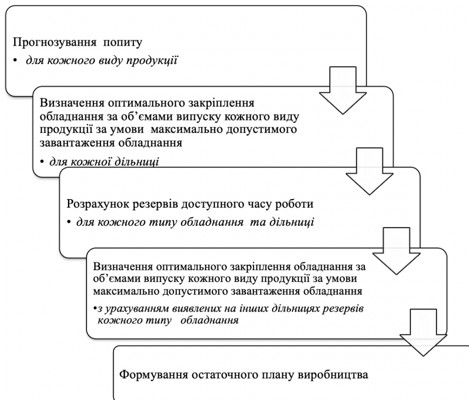
Рис.1. Етапи розв'язання задачі ефективного завантаження виробничої системи за паралельною схемою

Маємо зазначити, що задачу ефективного завантаження виробничої системи в умовах паралельної обробки слід розв'язувати за схемою (рис.1).