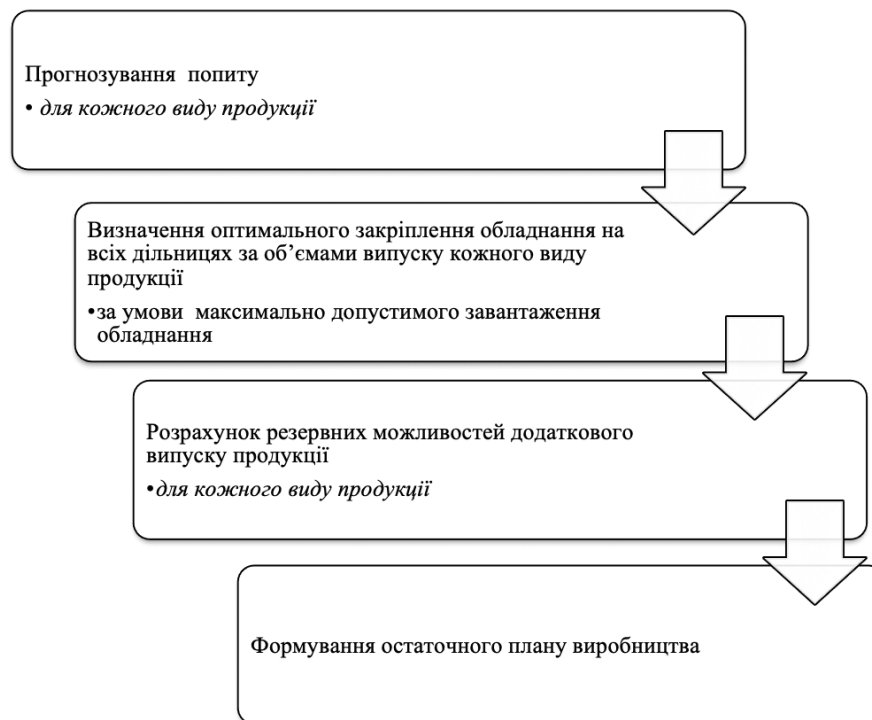
Рис.2. Етапи розв'язання задачі ефективного завантаження виробничої системи за послідовною схемою