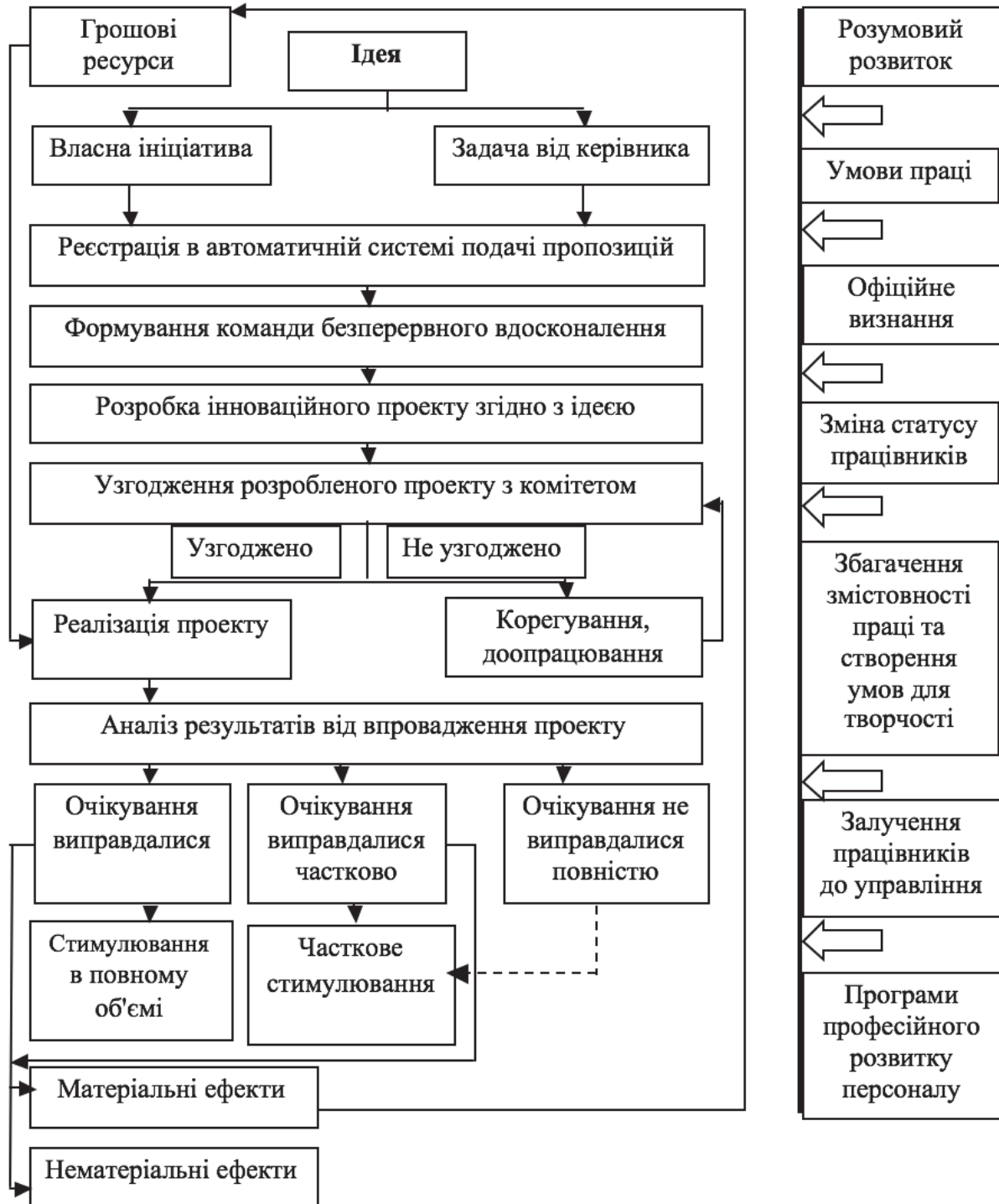
Рис. 2 Удосконалена система стимулювання інноваційної активності персоналу ТОВ «ЗЛМЗ» Побудовано авторами

– власна ініціатива – даний елемент має місце у тому випадку, якщо ініціатор, або група ініціаторів інноваційного нововведення самостійно пропонує якість нововведення та приймається до його розробки і реалізації;