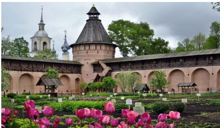
Рис. 1. Малий аптекарський сад Спасо-Евфимієва монастиря [6; 21]