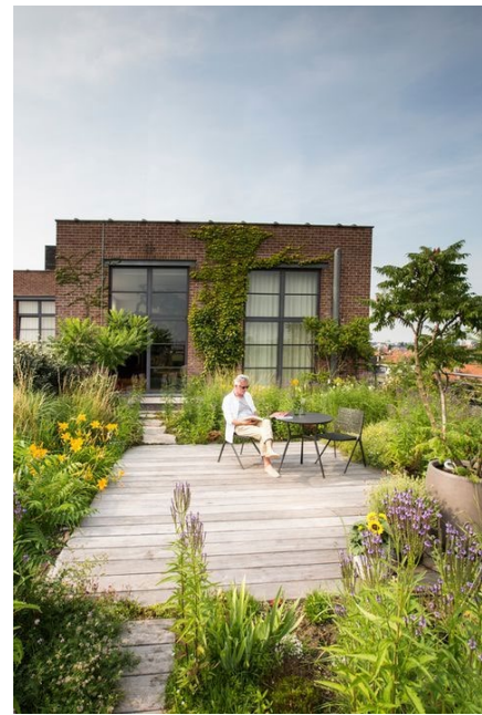
Рис. 4. Озеленення дахів як приклад малих садів у міському середовищі [14]