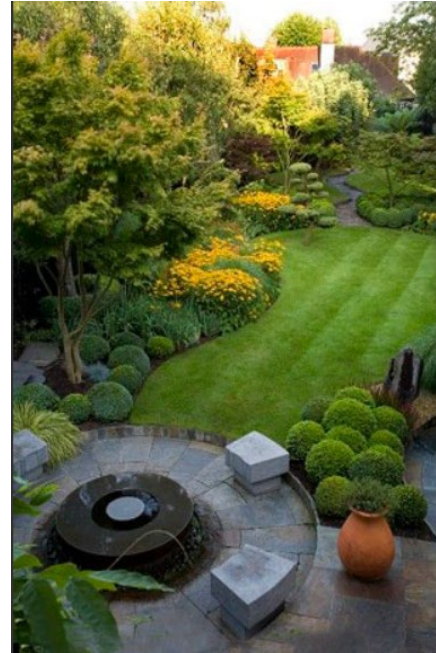
Рис. 3. Планування малого саду у регулярному та пейзажному стилях [11]