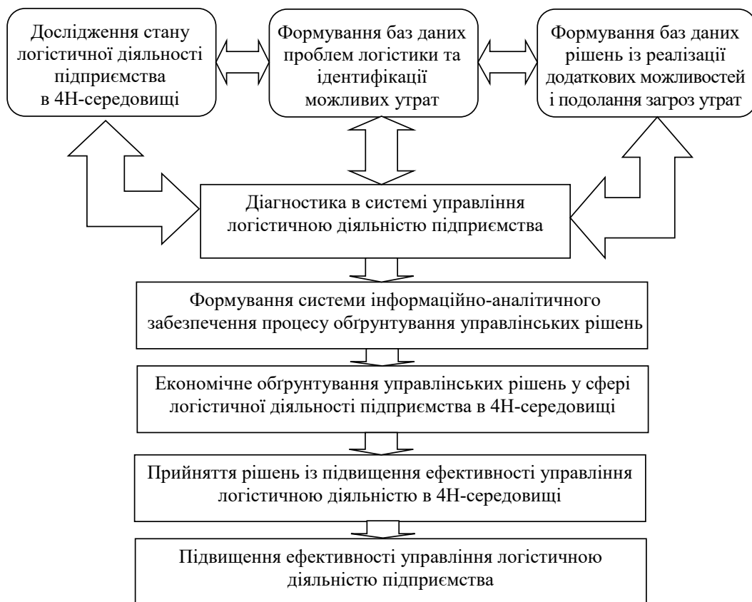
Рис. 1. Роль діагностики в процесі обґрунтування рішень у системі управління логістичною діяльністю підприємства

Діагностика повинна займати центральне місце в системі управління логістичною діяльністю підприємства. Із позицій управління діагностику слід розглядати у тісному взаємозв'язку з процесами планування, організації та контролю, що разом забезпечують оптимізацію матеріальних, фінансових і інформаційних потоків