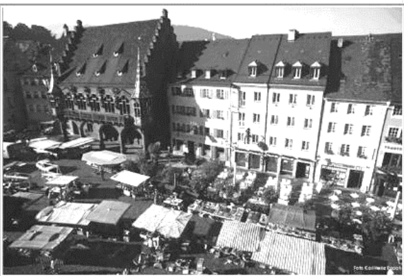
Рис. 3. Фрайбург, Німеччина [31]: до та після реконструкції

Особливо цінною бачиться практика реставрації та ревалоризації історичних ареалів міст Європи, зруйнованих під час світових воєн.