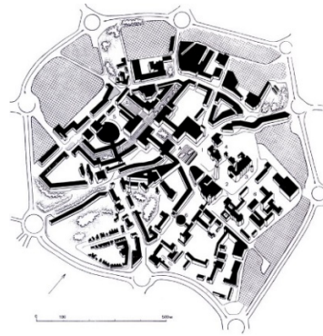
Рис. 4. Ковентрі, Великобританія. План реконструкції центральної частини міста за проектом арх. А. Лінга [32]

місті Олесниця художніми методами була адаптована нова габаритна забудова до історично сформованого середовища з організацією рекреаційних зон у системі історичних кварталів, що зазнають виправданій санації [30].