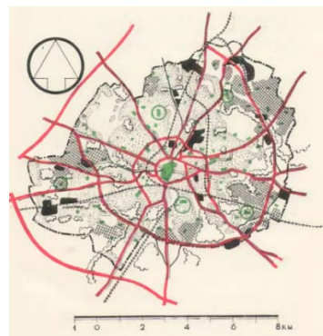
Рис. 5. Ковентрі, Великобританія. Схема плану реконструкції Ковентрі арх. Д. Гібсона [33]. Червоні лінії – нова система радіально-кільцевих магістралей; чорна заливка – новостворювані промислові райони; перехресна штриховка – нові житлові райони; точки – забудована територія; зелені прямокутники – існуючі і проєктовані магазини; кола – районні торгові центри; зелена заливка – загальноміський центр

У німецькому місті Фрайбург центр був зруйнований під час Другої світової війни та з часом відбудований з адаптацією внутрішніх просторів кварталів під рекреацію. Під час ревалоризації історичного центру міста був зроблений акцент на громадський транспорт та велодоріжки. У 1970-х роках центральна площа міста нагадувала величезну площу для паркування, нині тут розміщується ринок та громадські простори [30].