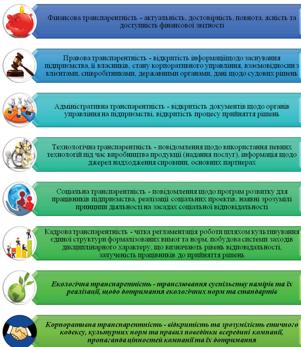
Рис. 2. Таксономія прозорості підприємства

Це призводить до висновку, що прозорість має певну граничну межу, за якою знаходиться інформація, непризначена для оприлюднення. Наприклад, комерційна таємниця, інформація про конкурентні переваги підприємства, інформація, оприлюднення якої обмежене законом. В той же час, бажання заволодіти такою інформацією дея-