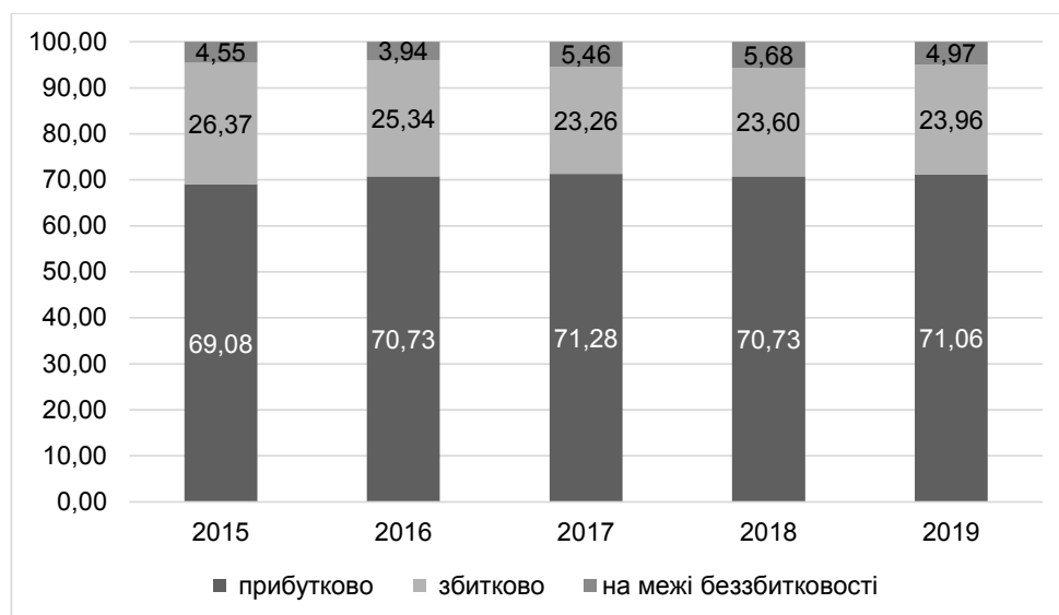
Рис. 2. Динаміка кількості державних підприємств України, які працювали збитково та прибутково