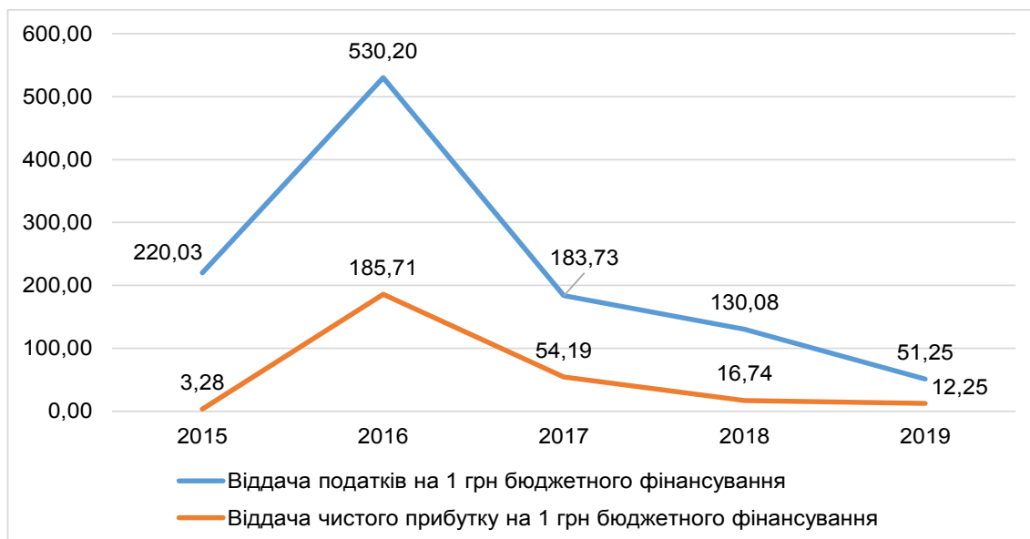
Рис. 4. Динаміка ефективності використання бюджетних коштів на фінансування державних підприємств України за 2015–2019 рр.