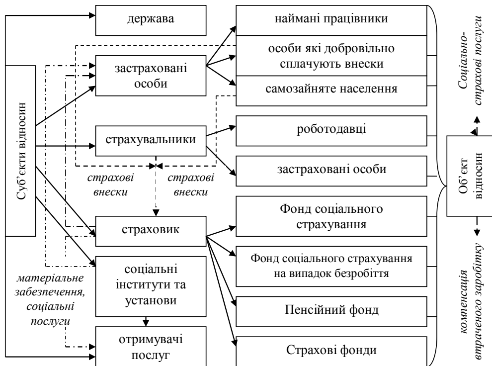
Рис. 1. Структура соціально-страхових правовідносин у системі соціального страхування