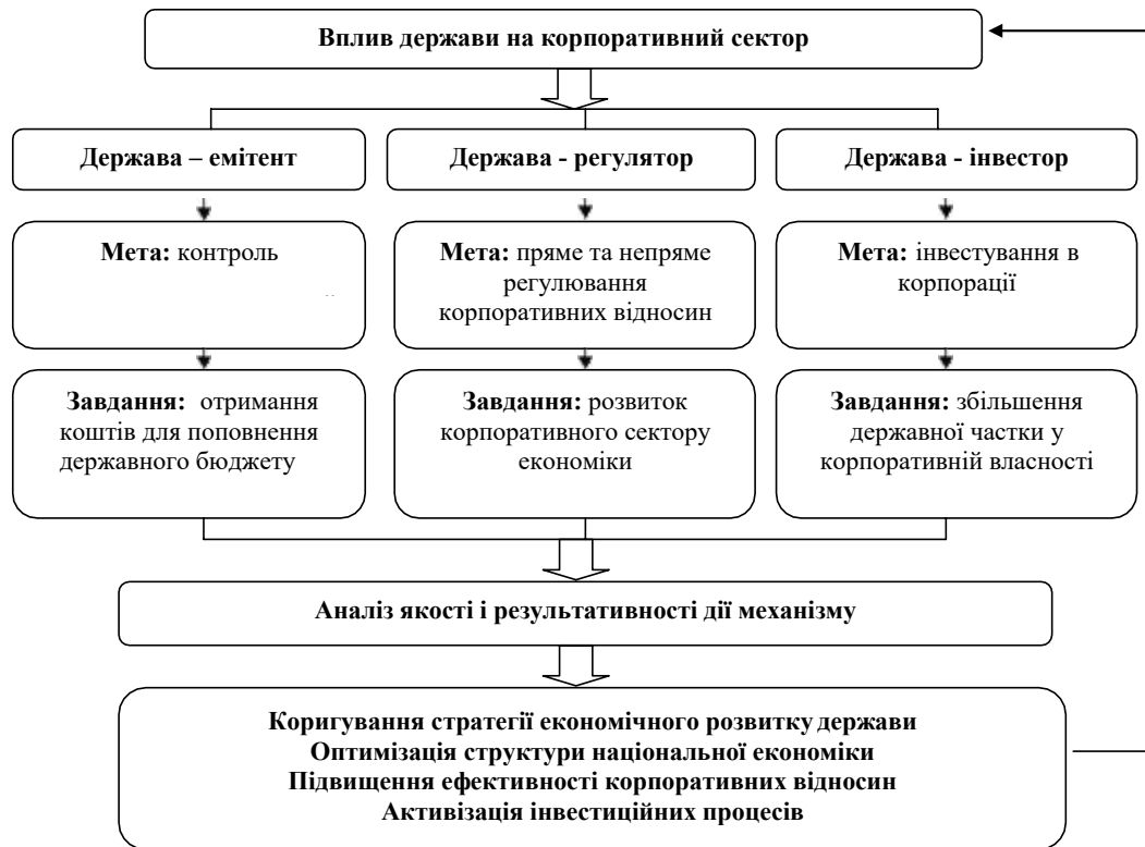
Рис. 1. Механізм впливу держави на корпоративний сектор економіки України [2, с. 97]

будь-яким економічним суб'єктом, в тому числі корпоративним сектором національної економіки, необхідно знати особливості його організації та визначати можливості та наукові основи механізму регулювання його ключових складових частин. Такий підхід дозволяє розкрити особливості його функціонування, проаналізувати причини та умови його рівноважного стану, обґрунтувати і виробити стратегічні напрями розвитку в довгостроковій перспективі.