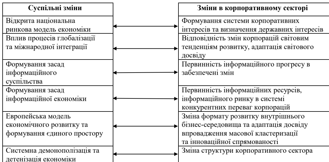
Рис. 2. Закономірності, передумови та взаємодія суспільних змін та змін у корпоративному секторі

Методологічною базою виявлення та обґрунтування передумов формування механізму регулювання корпоративного сектору національної економіки в ринковій економіці слугують сучасні наукові теорії аналізу галузевих ринків, теорії організації та моделювання корпоративного сектору економіки, результати дослідження структури галузевих і регіональних комплексів, теоретичні аспекти сучасного інституційного регулювання корпорацій, закономірності та принципи розміщення продуктивних сил галузей господарства, положення політики і стратегії розвитку національної економіки. Під поняттям механізму регулювання корпоративного сектору економіки ми розуміємо формування системного впливу на корпорації з метою перетворення, зміни, підтримки прогресивних змін.