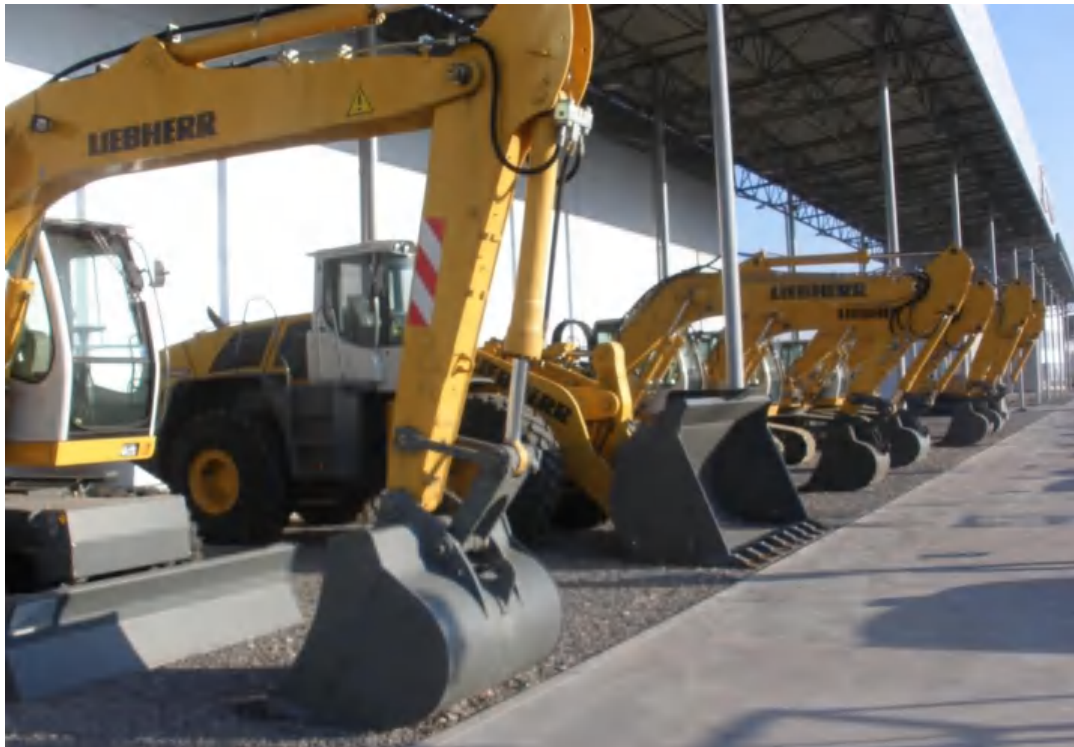
Фото 13. Експозиційні зразки сучасної спеціалізованої техніки "LIEBHERR".

В даний час колектив кафедри працює над удосконаленням навчальних планів і робочих програм. Готує нові спецкурси, курси нових навчальних дисциплін. Йде удосконалення навчально-лабораторної бази й удосконалення науково-методичного рівня викладання дисциплін.