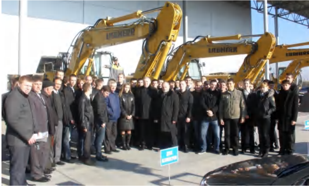
Фото 12. Заняття зі студентами механічного факультету на філії кафедри БДМ - ВАТ "АРМАДА".