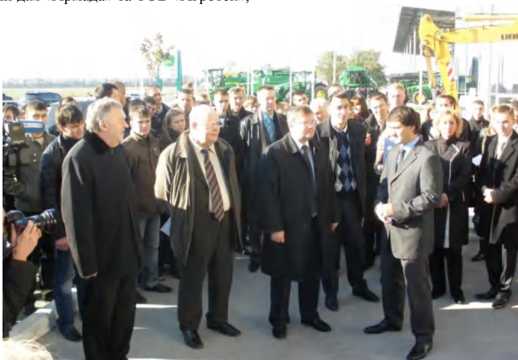
Фото 11. Відкриття філії кафедри будівельних і дорожніх машин на ВАТ "АРМАДА" та ВАТ "АГРОТЕК" (жовтень, 2011 р.).

Отримані на кафедрі знання успішно закріплюються на навчальних і виробничих практиках, що проводяться на базах провідних науково-дослідних, проектно-