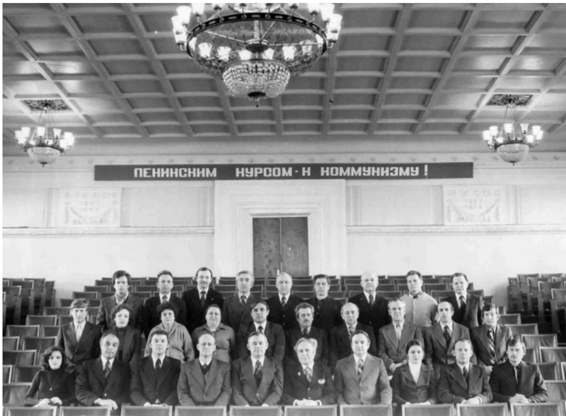
Фото 1. Кафедра «Будівельні і дорожнімашини» ДІБІ, 1980 р.