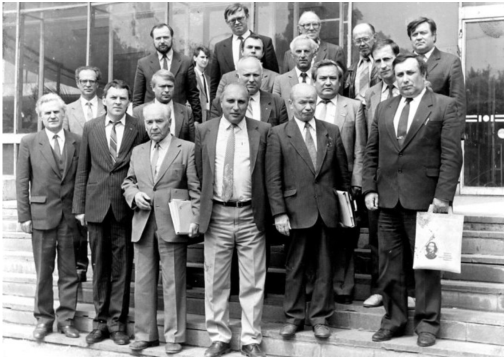
Фото 5. Учасники всесоюзної навчально-методичної ради СРСР з будівельних і дорожніх машин, механічному обладнанню та автоматизації будівництва (ДІБІ, 30 травня – 1 червня 1991 р.).