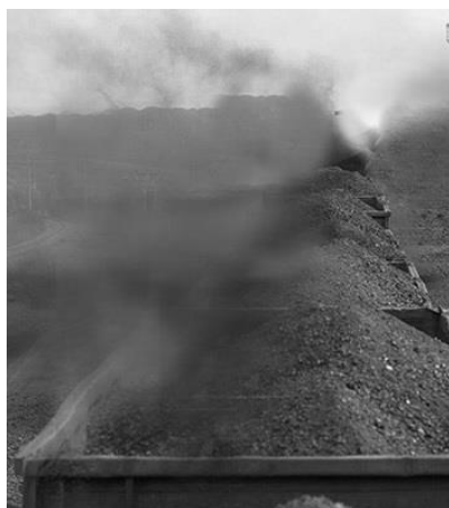
Рис. 1. Перевозка сыпучего груза железнодорожным транспортом / Transportation of bulk cargo

В этой связи, возникают две важные задачи: