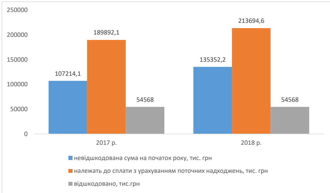
Рис. 3. Аналіз стану нарахування та відшкодування пільгових пенсій