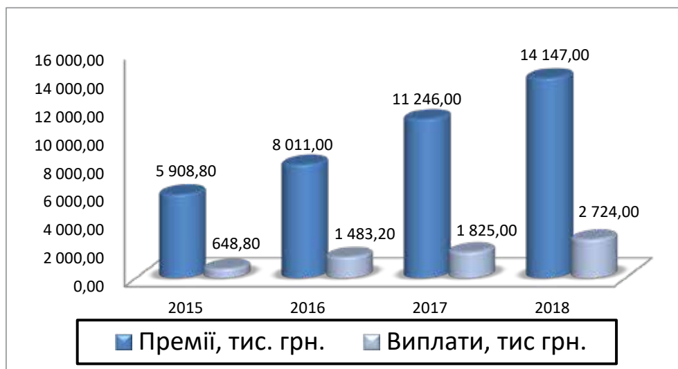
Рис. 6. Динаміка страхових премій та виплат за напрямом «Страховання туристів» СК «Арсенал Страхування», 2015–2018 роки, тис. грн. [3; 4; 5; 6]

ного випадку за кордоном в 2018 році становила 280 євро. У 6% випадків туристам знадобилося невідкладне стаціонарне лікування, середня вартість якого становила 3800 євро.