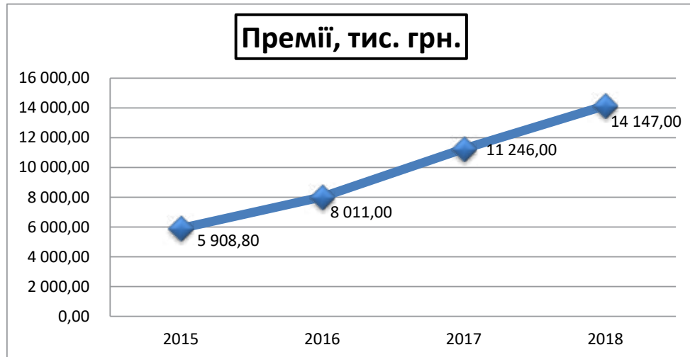
Рис. 4. Валові премії з туристичного страхування СК «Арсенал Страхування», тис. грн. [3; 4; 5; 6]

У 94% випадків туристи потребували амбулаторної допомоги. Середня вартість амбулатор-