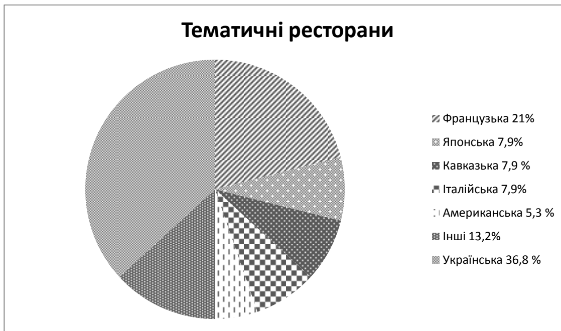
Рис. 2. Тематичні заклади громадського харчування в Україні