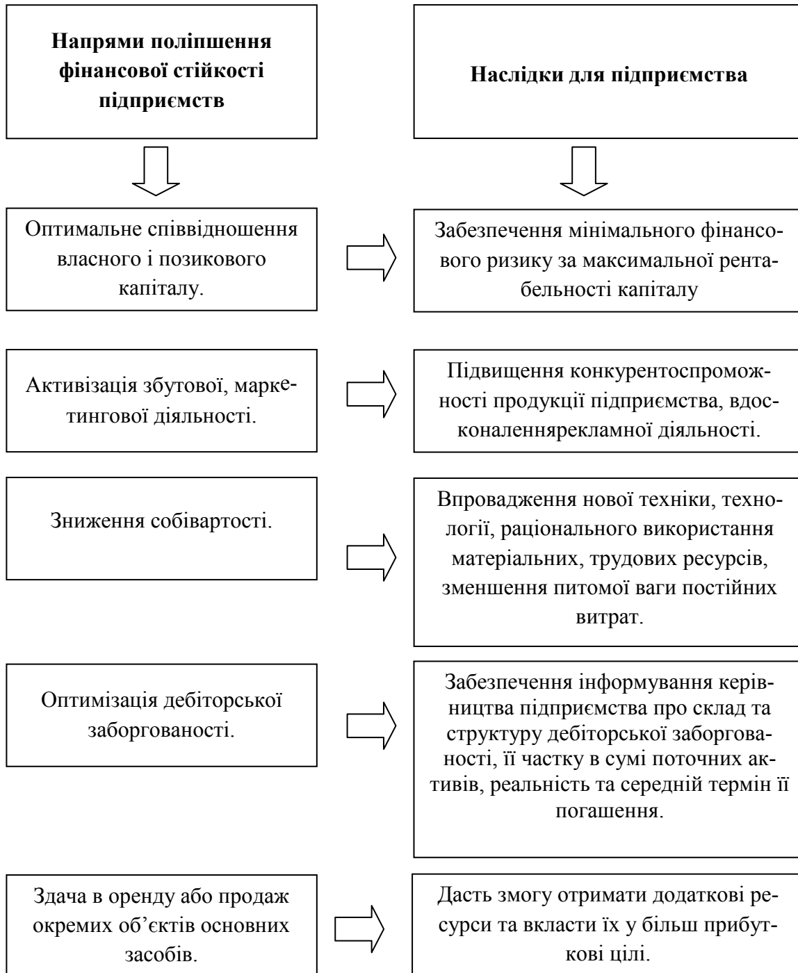
Рис. 2. Напрями поліпшення фінансової стійкості підприємств

пов'язано зі збільшенням обсягів виробництва продукції і зменшенням витрат на її одиницю. Тому можна стверджувати, що у більшості сфер діяльності українські підприємства майже позбавлені спроможності розвитку. Проте для деяких видів діяльності така ситуація частково може бути пояснена. Наприклад, у сфері торгівлі негативне значення власного оборотного капіталу може бути пов'язане зі специфікою