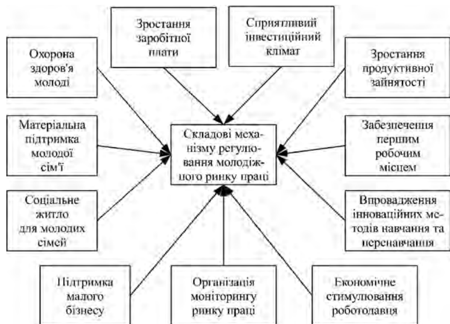
Рис. 2. Складові молодіжного ринку праці

У сучасних умовах ВУЗи України поступово втрачають значну частину своїх абітурієнтів насамперед через демографічні проблеми та