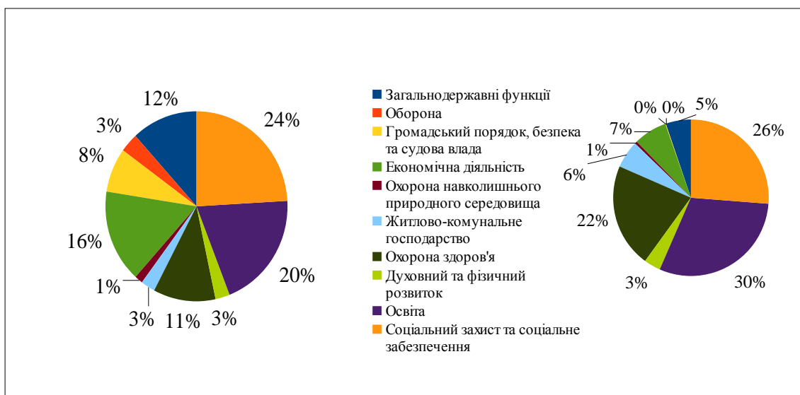
Рис. 1. Структура видатків Зведеного бюджету за 2011 та 2015 рр.

Слід відзначити, що частка соціальних видатків, які фінансуються з місцевих бюджетів, із кожним роком зростає. Якщо у 2011 р. 88,1% усіх витрат на соціальний захист та соціальне забезпечення фінансувалося із місцевих бюджетів, то в 2014 р. – 91,8%, у 2015 р. – 88,4%. Водночас збільшується й абсолютний розмір соціальних видатків. У 2015 р. він дорівнював 76 753 млн. грн. проти 43 781 млн. грн. у 2011 р. Частка видатків на соціальний захист та соціальне забезпечення в Україні станом на 2016 р. становить понад 30% Зведеного бюджету, це майже 11% від ВВП. Проте, якщо врахувати видатки фондів соціального