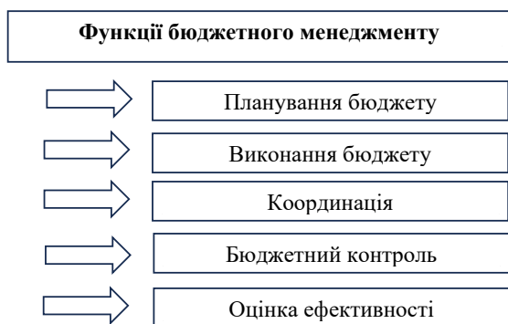
Рис. 1. Функції бюджетного менеджменту

Вважаємо, що до основних функцій бюджетного менеджменту можна віднести: планування бюджету, виконання бюджету, координація, бюджетний контроль, оцінка ефективності (рис. 1).