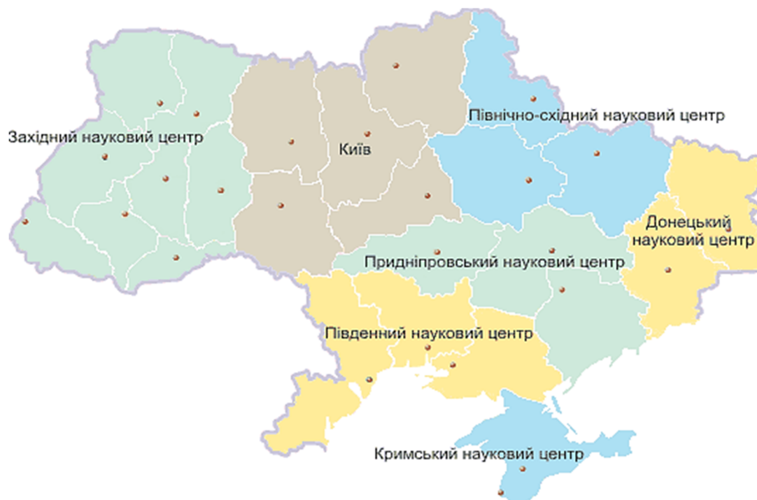
Рис. 4. Наукові центри НАН України та МОН України *

В Україні створено шість наукових центрів, які охоплюють декілька областей (рис. 4). Ареали їх дії загалом співпадають з межами економічних районів, які сформувались, виходячи з адміністративно-територіального поділу України з урахуванням етнічних та історичних особливостей областей, розміщення продуктивних сил і територіального поділу праці.