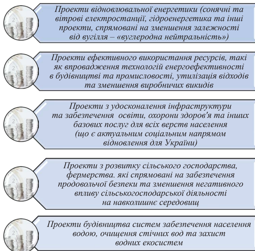
Рис. 3. Перспективні напрямки залучення ПІІ в економіку України в контексті реалізації Цілей сталого розвитку

Міжнародний досвід має певні практики страхування інвестицій від воєнних ризиків, які найчастіше забезпечуються державними установами, міністерством фінансів або незалежними організаціями, що створені спеціально для цієї мети. Подібні практики існують у Франції, Великій Британії, Японії, Канаді, Ізраїлі, Німеччині, Австралії та інших країнах. Але немає практики страхування інвестицій підчас активних військових дій в умовах повномасштабного вторгнення, тому це новий «кейс» для України та її партнерів, але без забезпечення цього напрямку говорити про можливість значного обсягу інвестування не варто.