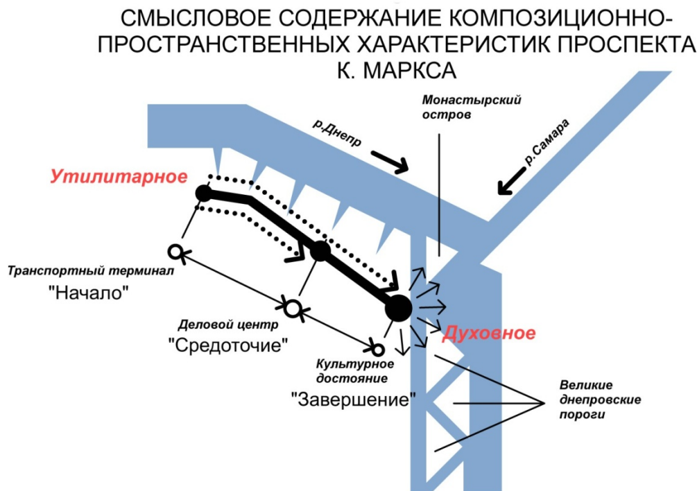
Рис. 3. Смысловое содержание композиционно-пространственных характеристик проспекта К. Маркса

Таким образом, Проспект получил естественное, функционально глубоко обоснованное продолжение в юго-западном направлении. Был закреплён и ярко подчеркнут смысловой статус всего юго-западного участка Проспекта и прилегающей к нему территории – духовно-просветительский (рис. 3).