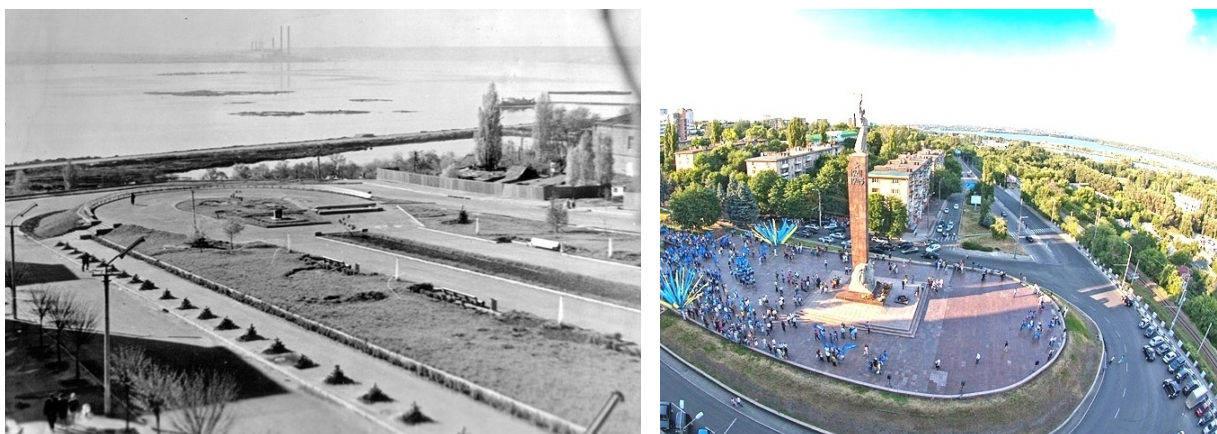
Рис. 1. Площадка застройки Мемориала «Вечная Слава»: начало строительства и современное положение

Строительство Монумента «Вечная Слава» стало для города Днепропетровска знаменательным событием (рис. 1). Сразу несколько важнейших смыслов обрели материальную форму. В первую очередь это, конечно, знак Великой победы, но одновременно это и логичное завершение главного проспекта города. Здесь, на видовой площадке, в сознании зрителя объединяются в единое целое город и пространство долины Великой реки.