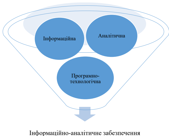
Рис. 1. Компоненти інформаційно-аналітичного забезпечення управління грошовими потоками підприємства

Автори робіт [1; 4, с. 38] стверджують, що функціонування інформаційно-аналітичного забезпечення здійснюється з урахуванням відповідних складових: інформаційної та аналітичної. Але, на нашу думку, інформаційно-аналітичне забезпечення управління грошовими потоками варто доповнити програмно-технологічною складовою. Компоненти інформаційно-аналітичного забезпечення управління грошовими потоками підприємства наведена на рис. 1.