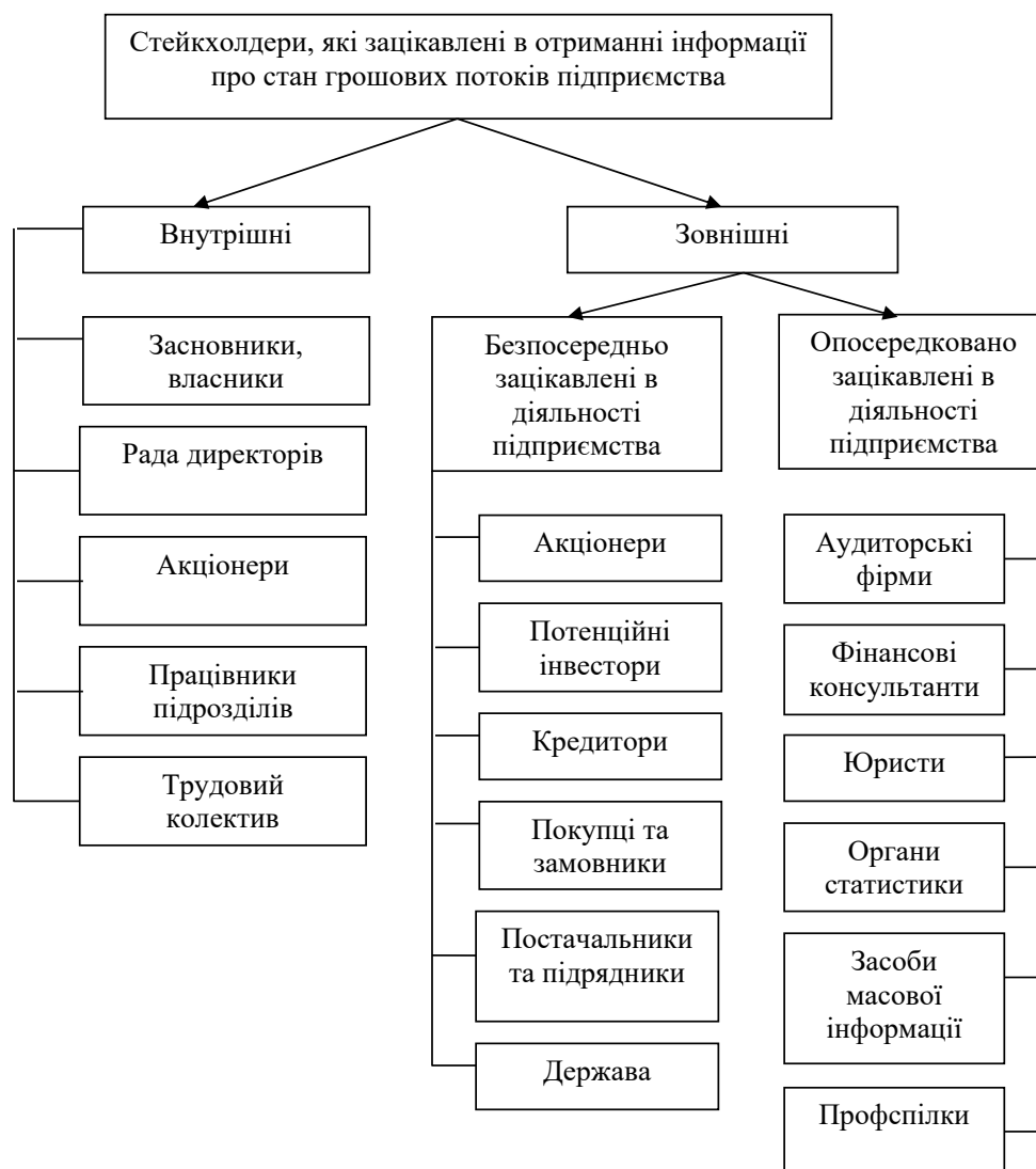
Рис. 3. Класифікація стейкхолдерів, які зацікавлені в отриманні даних про грошові потоки підприємства