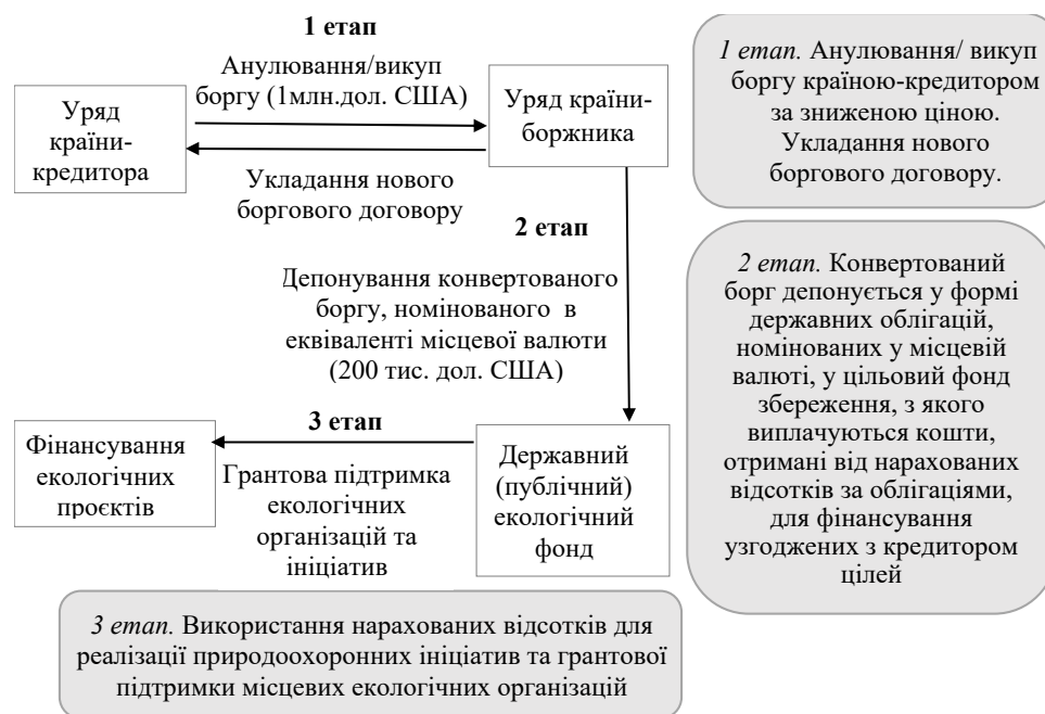
Рис. 1. Схема двостороннього зеленого свопу (Bilateral Debt-for-Nature Initiative)