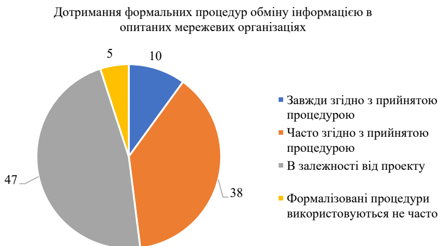
Рис. 2. Дотримання формальних процедур обміну інформацією в опитаних мережевих організаціях

З іншого боку, проведені дослідження дозволяють зробити висновок, що певний рівень формалізації може мати позитивний вплив на процес комунікування. Особливо це стосується організацій, які знаходяться на етапі зародження та зростання і прагнуть збільшити обсяг і диверсифікувати свою діяльність.