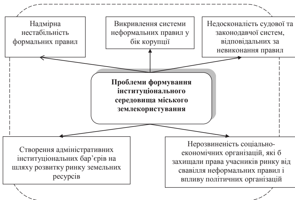
Рис. 1. Основні блоки проблем формування інституціонального середовища міського землекористування в Україні

Таким чином, наявна інституціональна структура міського землекористування не відповідає