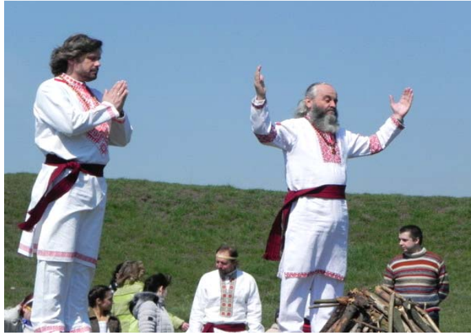
Рис. 3. Сучасне свято Ярила на Мавринському майдані

кожного року прихильники там проводять День Ярила. У сонця, місяця, зірок просили своєчасних дощів, тепла, врожаю, приплоду, здоров'я, достатку. В ім'я всього цього приносили в жертву тварин. Тут здійснювали ритуал проводів у Вічність через вогнище. На цьому місці мислили про вічність і про безсмертя душі... А тепер на майдан приїжджають громади з різних міст та приєднуються до свята, тому свята на Мавринському майдані поступово перетворюються на ведичні фестивалі в українському народному стилі [9, с. 12].