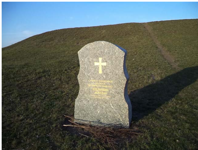
Рис. 1. Пам'ятник славним запорізьким козакам від вдячних нащадків на Мавринському майдані

Розглянемо версії походження майдану. Версія перша. Майдан – козацька оборонна споруда.