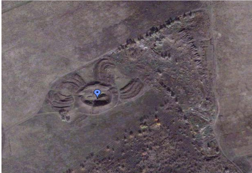
Рис. 2. Мавринський майдан – вид з космосу

Майдан із його дивовижними валами, цілком можливо, використовувався запорізькими козаками як сторожова вежа і як оборонна споруда [1, с. 7]. Козаки завжди були напоготові до бойових зіткнень. На півдні загрожували набіги турків і татар, з півночі – литовські та польські феодали. Окремі історики висловлюють припущення, що саме козаки будували цю споруду. Або ж використовували для цього кургани, які після такого втручання втрачали свою звичну форму. Якби майдан не вдалося побачити зі значної висоти, можливо б, не з'явилися запитання, які налаштовують на нові роздуми: