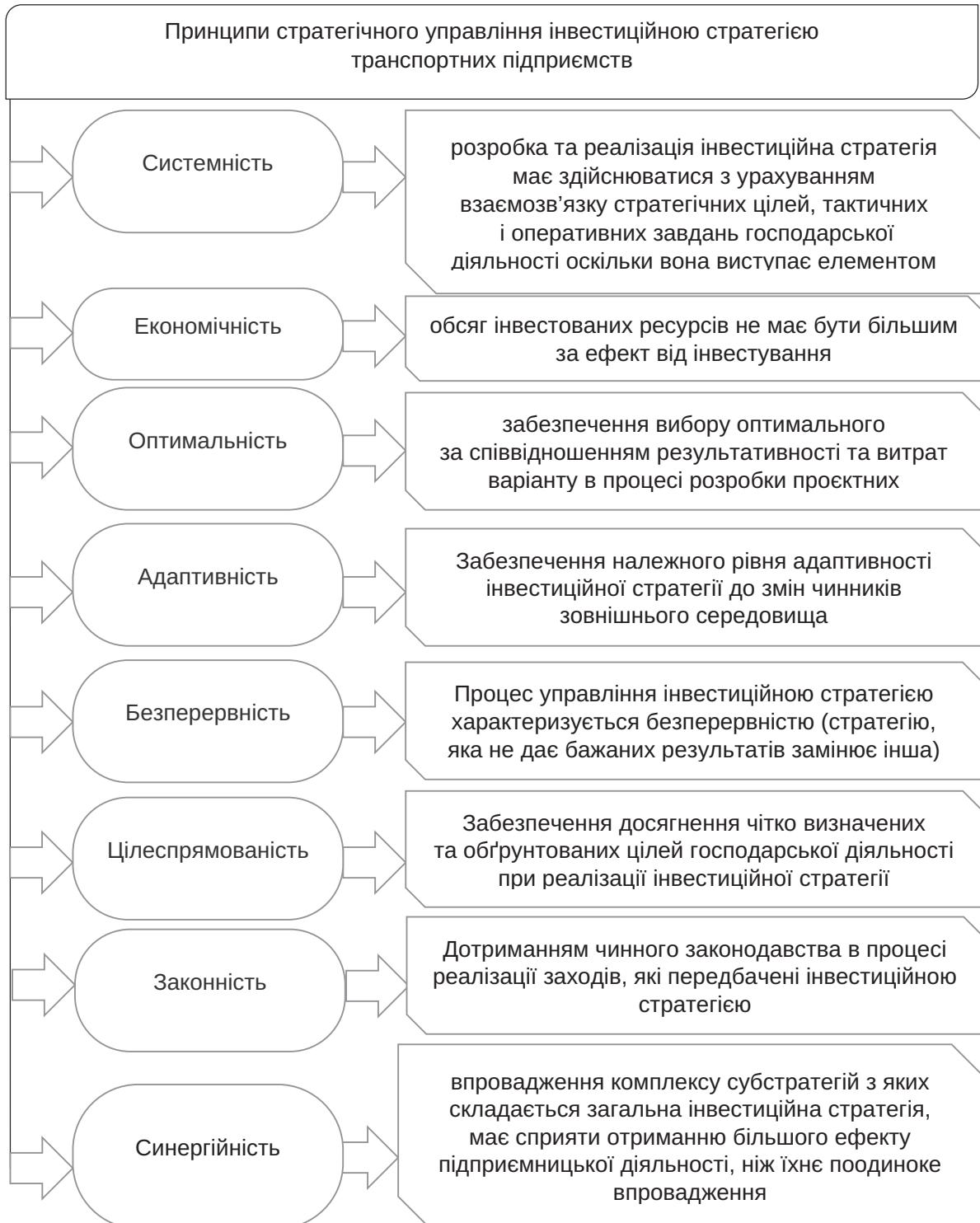
Рис. 1. Принципи стратегічного управління інвестиційною стратегією транспортних підприємств

підкреслити позитивну динаміку щодо збільшення капітальних інвестицій у нематеріальні активи в останні роки, що свідчить про певне зміщення акценту, що можна пов'язати із тенденціями неомодернізаційного оновлення [1]. Проте, незважаючи на зростання вартості інвестицій