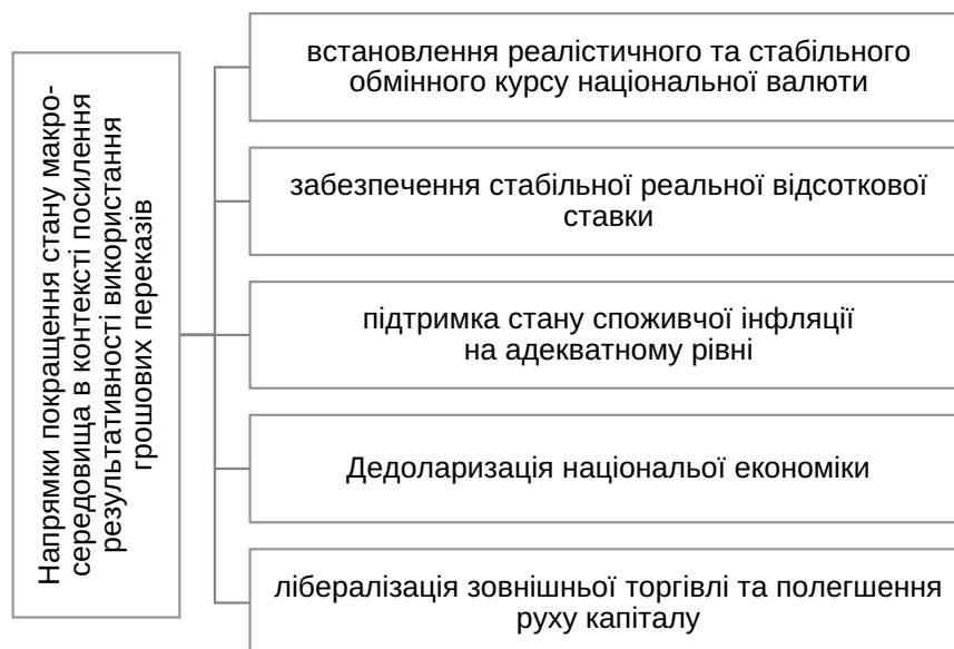
Рис. 3. Напрямки покращення стану макро-середовища в контексті комплексу державної політики зі стимулювання цільового використання грошових коштів міжнародних трудових мігрантів