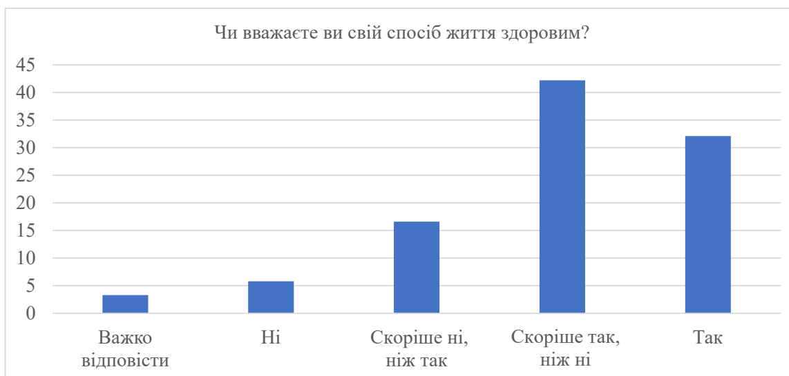
Рис. 2. Результати опитування «Чи вважаєте ви свій спосіб життя здоровим?» 6

вживали будь-які наркотики щонайменше один раз в житті. Поширеною проблемою здоров'я молоді є хвороби імунної системи, зокрема ВІЛ. Щороку близько 100 дітей народжується з цією хворобою, а загалом, в Україні проживає близько 15 тис. молодих людей з ВІЛ. Частина (11 тис.) є інфікованою внаслідок сексуальних контактів, інша частина – через внутрішньовенний ввід наркотичних речовин. Серед причин поширення ВІЛ є недостатність знань стосовно передачі хвороби, слабка популяризація шляхів запобігання та уникнення ВІЛ-інфекції [14]. У Львівській області спостерігається значно нижчий показник поширеності ВІЛ-інфекції порівняно з середнім по країні, а саме – 158 випадків на 100 тис. населення. Темпи приросту захворювання на ВІЛ знизилися, але зросли темп приросту захворювання на СНІД. Це вказує на недоліки діагностування (тривалість та неточність) [9].