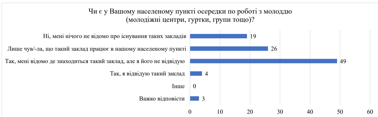
Рис. 5. Розподіл відповідей на запитання «Чи є у Вашому населеному пункті осередки по роботі з молоддю (молодіжні центри, гуртки, групи тощо)?» 10