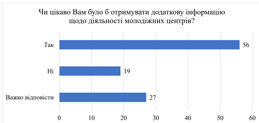
Рис. 6. Розподіл відповідей на запитання «Чи цікаво Вам було б отримувати додаткову інформацію щодо діяльності молодіжних центрів?» 11