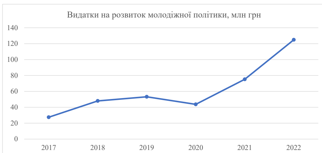
Рис. 3. Видатки на розвиток молодіжної політики, млн грн 8