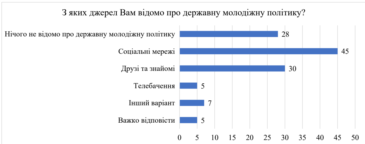
Рис. 4. Розподіл відповідей на запитання «З яких джерел Вам відомо про державну молодіжну політику?» 9