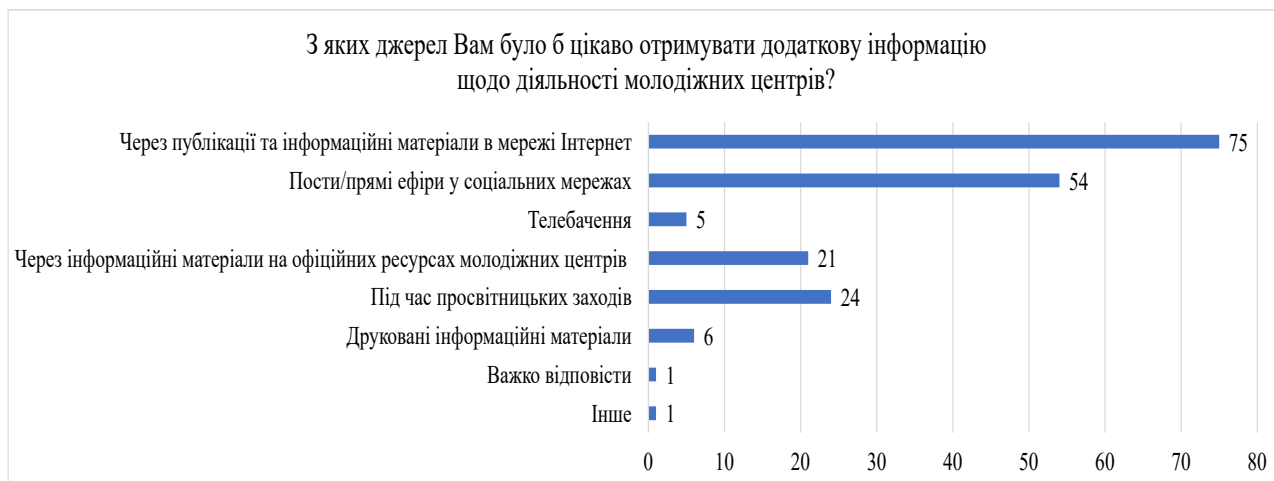
Рис. 7. Розподіл відповідей на запитання «З яких джерел Вам було б цікаво отримувати додаткову інформацію щодо діяльності молодіжних центрів?» 12

Присутня також проблема низького рівня компетентності фахівців молодіжної сфери та сертифікації молодіжних центрів. Причиною цього можна вважати те, що досить довго поняття «молодіжний працівник» та «молодіжна інфраструктура» не знаходили свого закріплення в українському законодавстві. В Україні відсутня ефективна навчальна система підготовки для фахівців молодіжної сфери, що зумовлює недостатній рівень їх готовності до проведення результативної діяльності. Що стосується молодіжних центрів, то сертифікація є необхідною для залучення до європейської мережі, яка дозволить обмінюватись досвідом, реалізувати спільні проєкти та залучати додаткові кошти [22]. Останньою, але не менш важливою, є проблема нормативно-правової бази. Існує значна розбіжність в термінології, оскільки при укладанні нових законів не здійснювався аналіз чинних на той момент актів. Це призводить до зниження ефективності цих законів або до повної неможливості їх реалізації [23].